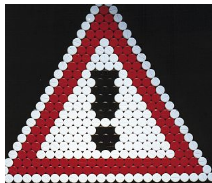
Bei der Kombination von Statinen und Makroliden ist Vorsicht geboten.

Bei der Interaktion zwischen Statinen und Makroliden handelt es sich um eine pharmakokinetische Interaktion, bei der die Metabolisierung der Statine gehemmt wird und dadurch höhere Plasmakonzentrationen resultieren (3, 7). Da sowohl Statine ein unterschiedliches Metabolisierungsmuster haben, als auch Makrolide unterschiedlich starke Enzymhemmung zeigen, ist das Interaktionspotenzial jedes Arzneistoffs getrennt zu beurteilen.